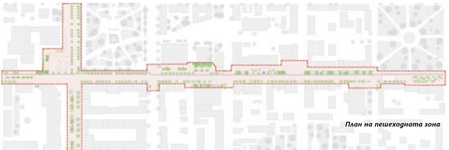
План на пешеходната зона

Загачи. В настоящия проект поставяме няколко основни цели и задачи.