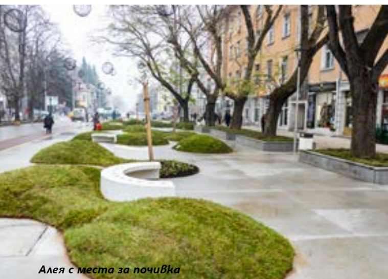
Алея с места за почивка